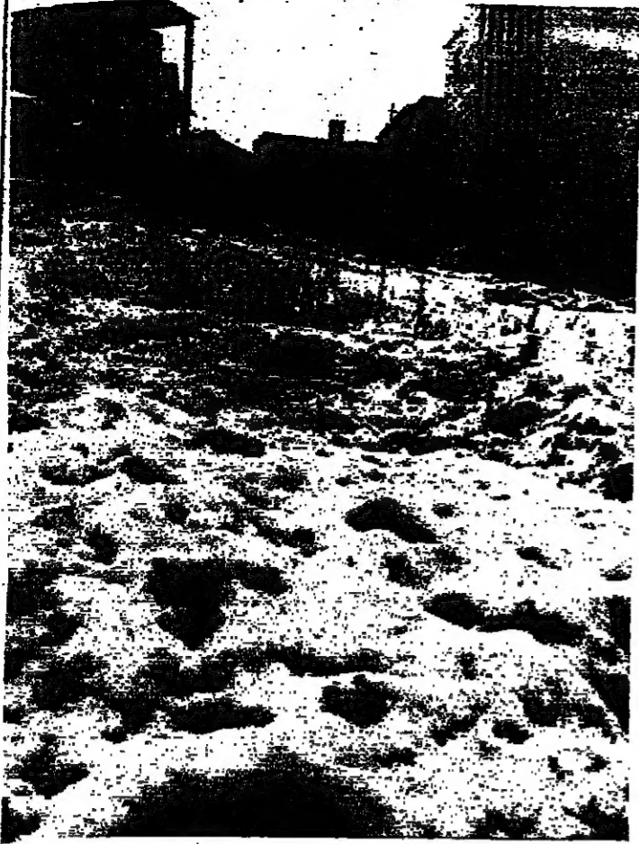
■ اللوج في عاليه ■